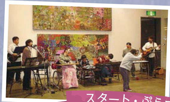
スタート・ぱらす

Myカルテットは、メンバーそれぞれが室内楽やオーケストラで研鑽を重ねている。学校や幼稚園、病院などへの訪問演奏を行っているほか、自主公演では、それぞれの日本のトッププレーヤー達と共演。2009年二度目のギリシャでは、乳癌撲滅チャリティーコンサートに出演し好評を博す。ジャンルを超えた幅広いレパートリーを持っており、選曲や構成にも趣向を凝らし、常に初心を忘れず演奏の向上を目指している。