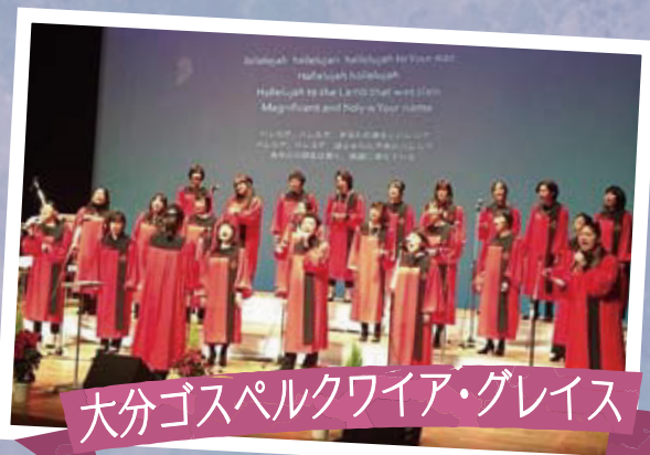
大分ゴスペルクワイア・グレイス

一人ひとり それぞれが出せる音を加えながらメロディーをつくる足し算のバンドです。毎回演奏が違いますが、それがスタートらしさだと楽しんでいます。クリスマスにちなんだ曲を練習中です・・・♪