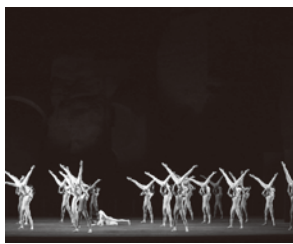
ダンス 東京バレエ団