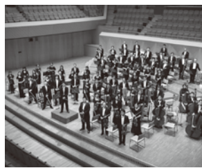
管弦楽 神奈川フィルハーモニー管弦楽団