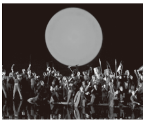
合唱 二期会合唱団