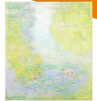
クロード・モネ(睡蓮)1908年 ©東京富士美術館イメージ・カブ DNPartcom.jpg