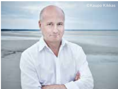
パーヴォ・ヤルヴィ(指揮)

ベートーヴェン 交響曲第7番 長調 ほか 全席指定 GS席10,000円、S席8,000円、 A席6,000円、B席4,000円、 C席2,000円 U25割:A・B・C席のみ半額