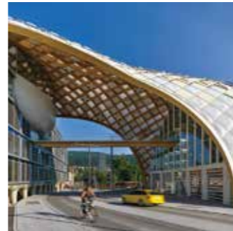
スワッチ本社