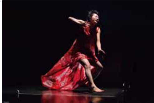
森下真樹 撮影 bozzo