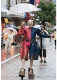
▲府内五番街(大分市)にて