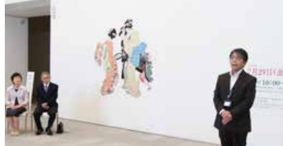
▲「片岡辰市コレクションの精華」内覧会(7/29)