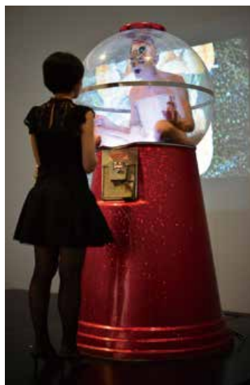
▲「アイボール 目からウロコ! エネルギーの交換会」(7/17)