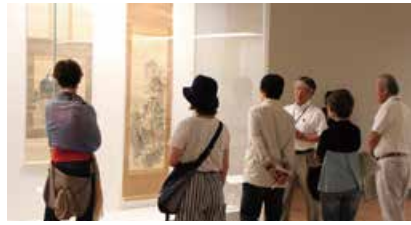
▲会期中の金・土曜に行われた「ギャラリートーク」