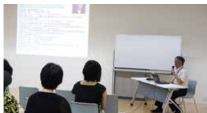
▲講演会「片岡辰市コレクションを語る」(8/6)