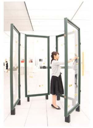
▲藤本 由紀夫 《The Music(four-panel folding screen)》 2013年