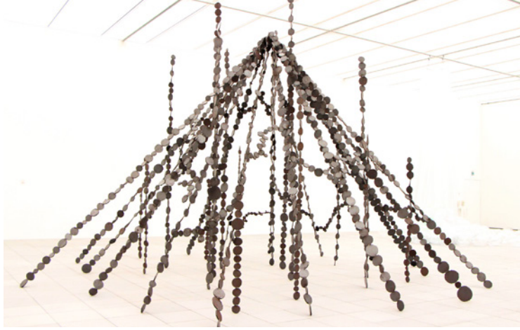
▲青木 野枝《蒸気管 / 寿町》 2016年