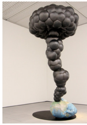
▲戸田 裕介 《Bonfire / Jの夢》 2016年